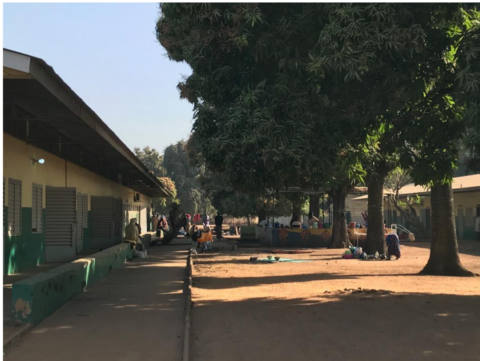
L'hôpital de Moundou : hôpital pavillonnaire construit dans les années 1950 (Le circuit d'eau et d'électricité est vétuste et mériterait une réfection totale)