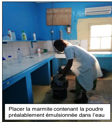
Placer la marmite contenant la poudre préalablement émulsionnée dans l'eau