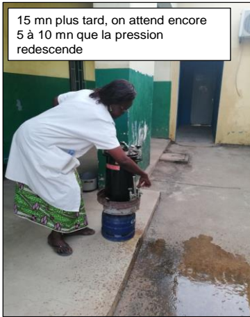
15 mn plus tard, on attend encore 5 à 10 mn que la pression redescende