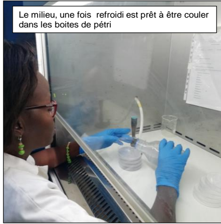
Le milieu, une fois refroidi est prêt à être couler dans les boites de pétri