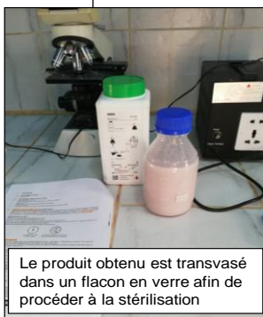
Le produit obtenu est transvasé dans un flacon en verre afin de procéder à la stérilisation