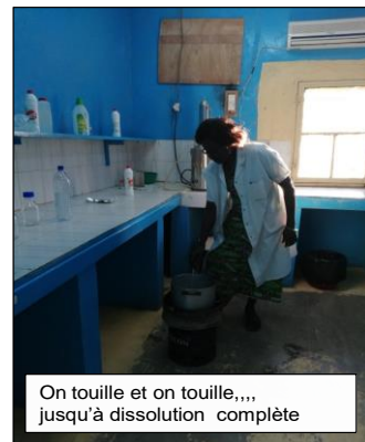
On touille et on touille,,,, jusqu'à dissolution complète