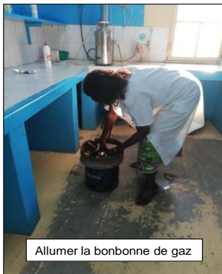
Allumer la bonbonne de gaz