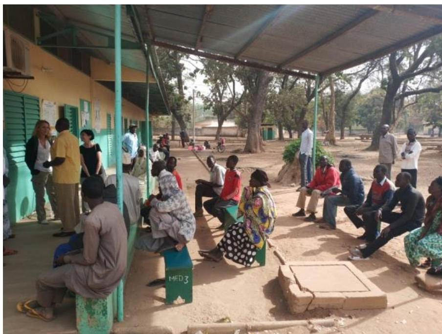
La salle d'attente du service tuberculose où se fait la distribution des traitements