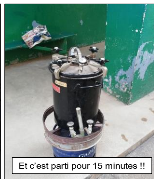
Et c'est parti pour 15 minutes !!