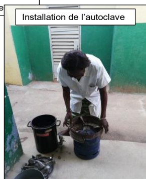
Installation de l'autoclave