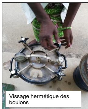
Vissage hermétique des boulons