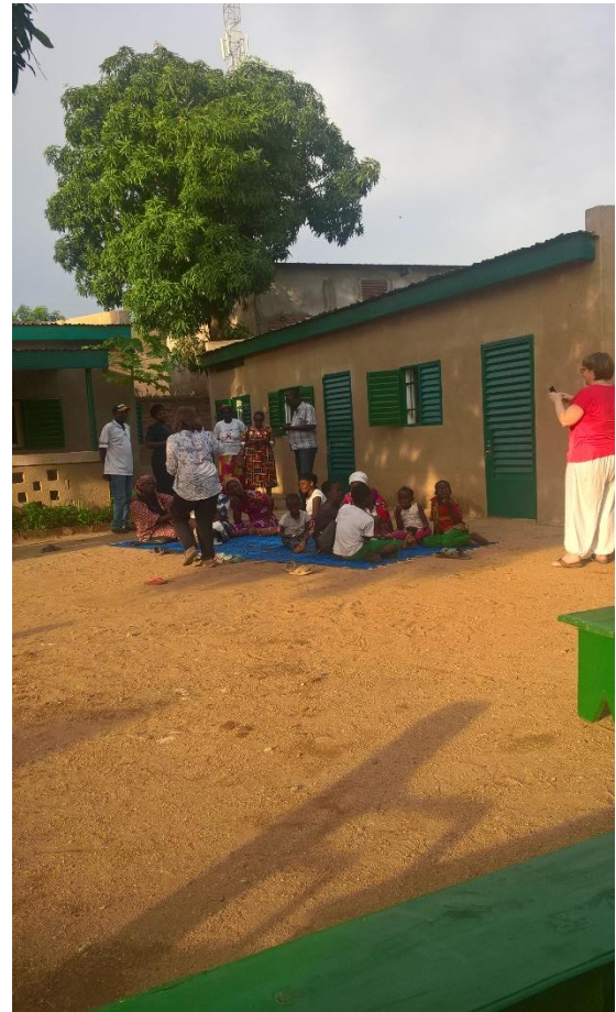
La Maison d'Accueil Provisoire à Moundou (MAPAM) : danse avec les enfants et rencontre avec les associations de malades.