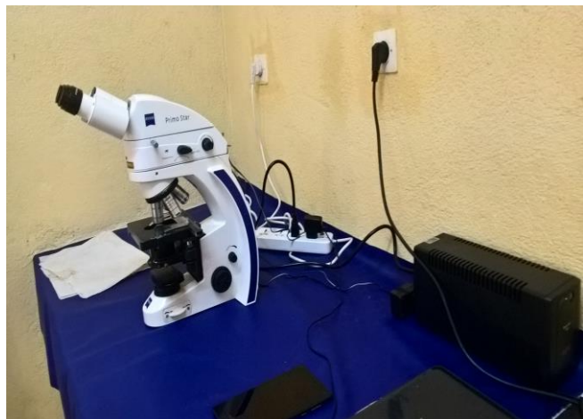
Laboratoire de la tuberculose que nous avons inauguré en 2014, (appareil GenXpert et microscope à fluorescence) toujours fonctionnel grâce au compagnonnage