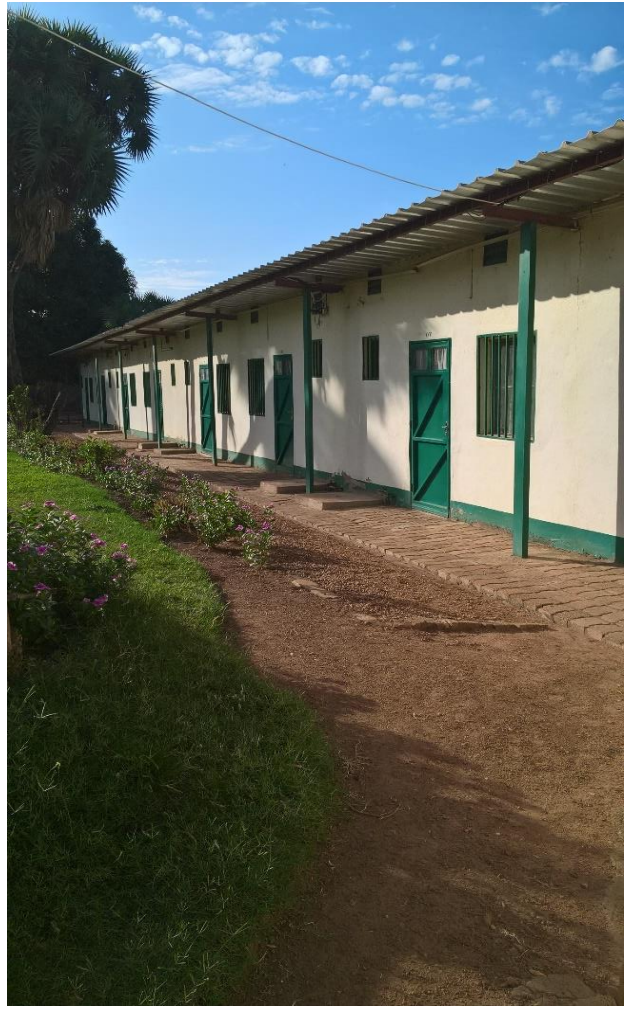
L'hôtel de la Coton Tchad ou nous logeons