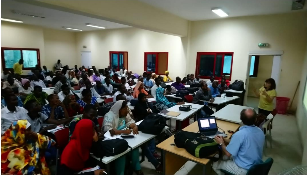
Cours à la faculté de médecine pour 120 étudiants en médecine, très participatifs